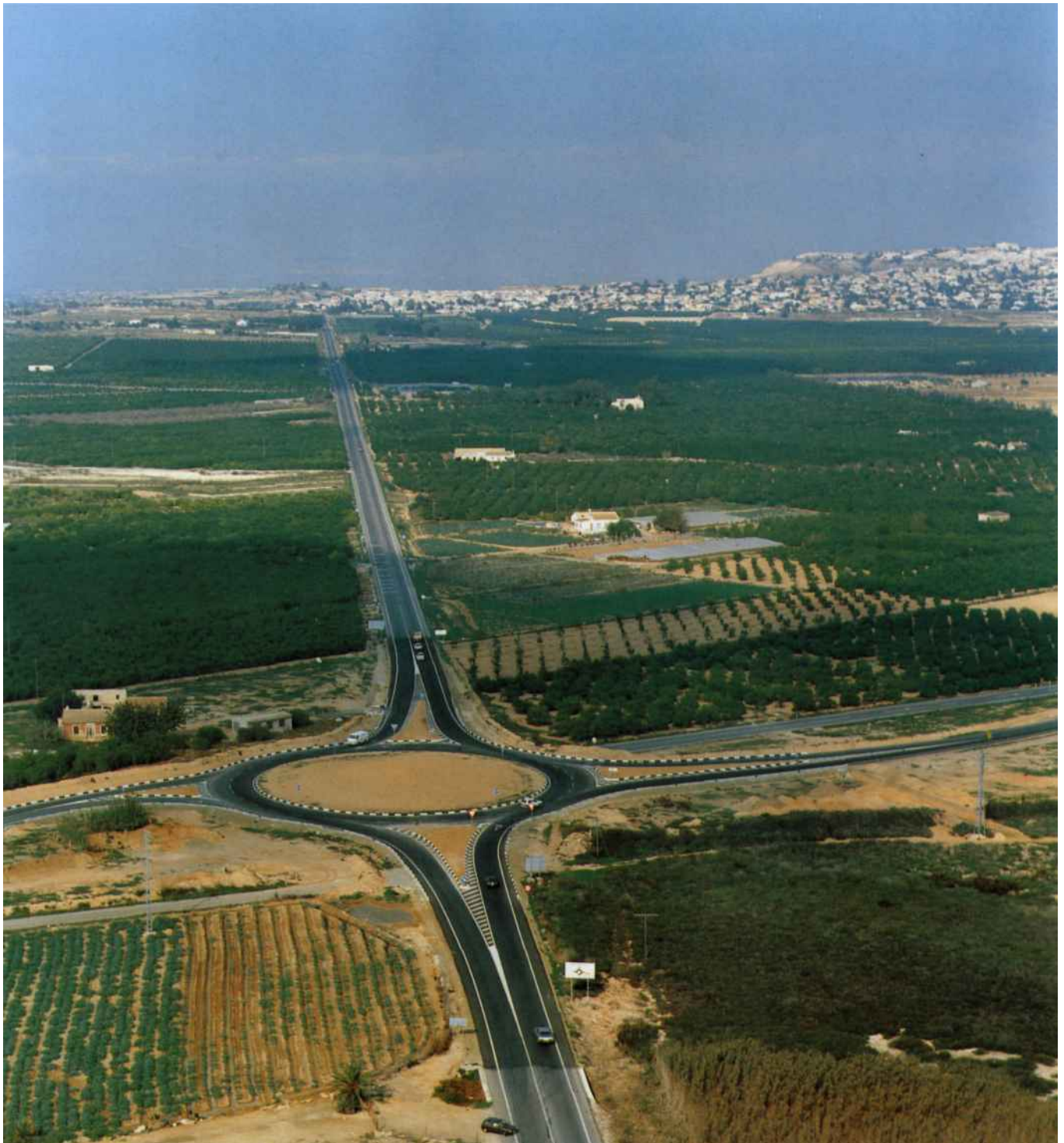
Glorieta entre la carretera C-3321 y el acceso a Guardamar.