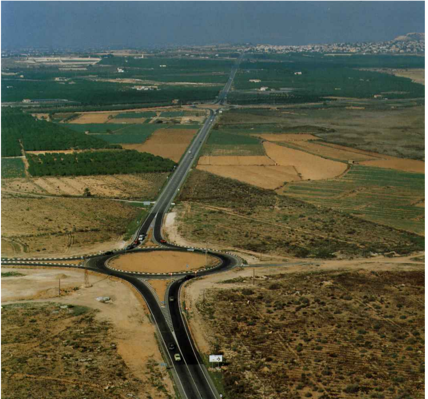
Glorieta entre la carretera C-3321 y el acceso a Los Montesinos.

PORTADA: Vista panorámica desde Torrevieja.