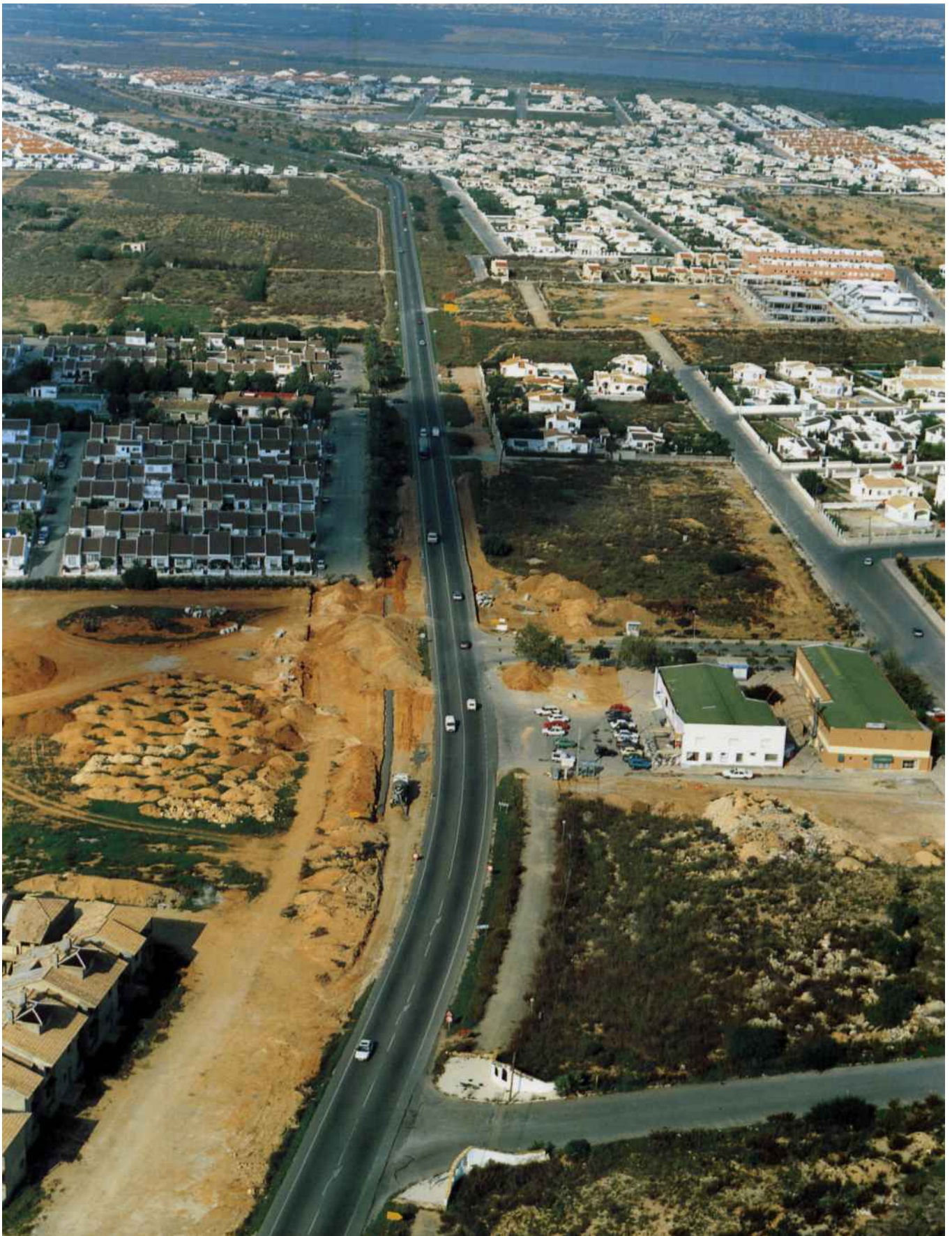
La carretera entre Benijófar y Torrevieja atraviesa un paraje natural de alto valor medioambiental densamente ocupado por urbanizaciones que provocan un tráfico intenso con numerosos problemas de seguridad vial.